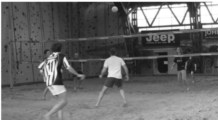
Voetvolleybal A en B junioren