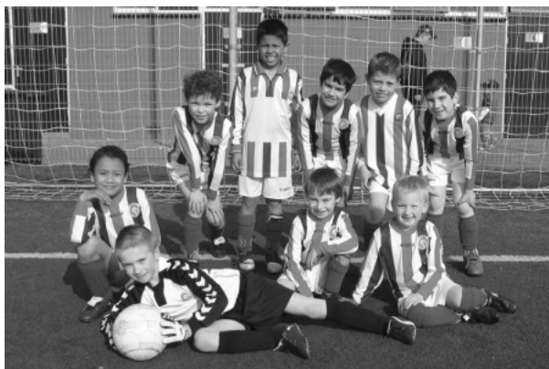
GHC F5, seizoen 2006-2007

Binnen deze algemene indeling worden spelers ingedeeld in teams: de F1, F2 etc. Geprobeerd wordt spelers van vergelijkbaar niveau en leeftijd samen te brengen. Te grote verschillen in leeftijd of kwaliteit binnen één team zijn niet leuk, niet voor de 'betere' of oudere spelertjes en evenmin voor de 'mindere' of jongere. Ook het creëren van een goede sfeer speelt echter een rol bij deze indeling.